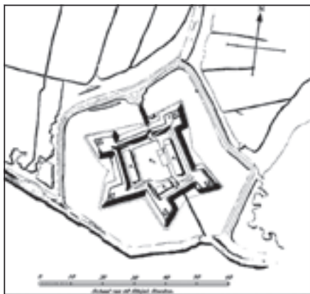
De Schans op Texel

Het fort – dat hoog boven de toen nog zeer lage zeedijk uitstak – was blijkbaar afschrikwekkend genoeg, want echte gevechten hebben er nooit plaatsgevonden. Ook niet tijdens de slag bij Callants-oog in 1799. Deze laatste was echter wel reden voor Napoleon om de Schans aan de landzijde te versterken. De vuurkracht van het fort was tot die tijd voornamelijk op zee gericht geweest. Aangezet door de strategie van zijn Engelse vijanden, versterkte Napoleon de landzijde. In 1810 werd begonnen met de aanleg van steunforten ter linker- en rechterzijde van de Schans en Napoleons plannen voorzagen ook in de bouw van een derde steunfort aan de noordzijde. Deze laatste versterking is er nooit gekomen, zomin als de wallen rond de in 1780 gegraven haven van Oudeschild en de versterking op Texels zuidpunt. Wel werd de Schans uitgebreid met een ravelijn, een nieuwe, bredere gracht en rondom een ‘bedekte