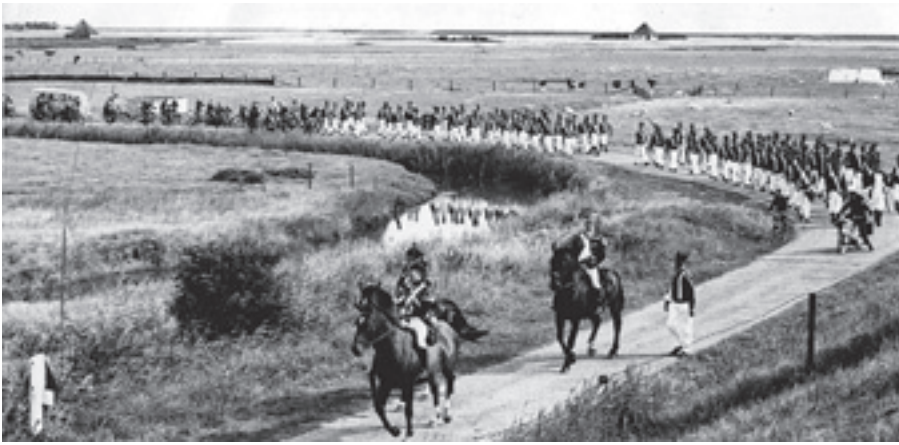
De 'tocht naar de Schans' uit 1813 is in 1963 nagespeeld

weg' waarlangs troepen de buitenrand van het fort konden beschermen. Dit alles werd ondersteund met een inundatiesluis in de dijk, waardoor het achterliggende land onder water kon worden gezet.